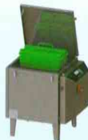
פיסטור II Pasteur