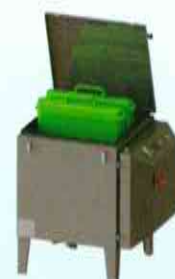
מפשיר - Thaw